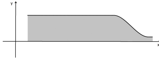
Figure 1: La región sombreada se rota 360 grados alrededor del eje x generando un sólido de revolución.

En algunos de los siguientes problemas se usan volúmenes de sólidos de revolución y áreas de superficies de revolución. Recordar que si f : [a, b] \rightarrow \mathbb{R} es continua y no negativa, entonces el volumen del sólido de revolución generado al rotar (360 grados) alrededor del eje x la región en el plano xy acotada por el eje x , la curva y = f(x) , y las rectas x = a , x = b , está dado por V = \pi \int_a^b (f(x))^2 dx (ver las figuras 1 y 2). Similarmente, al rotar 360 grados alrededor del eje x la curva y = f(x) , con x \in [a, b] , se genera una superficie cuya área está dada por A = 2\pi \int_a^b f(x) \sqrt{1 + (f'(x))^2} dx .