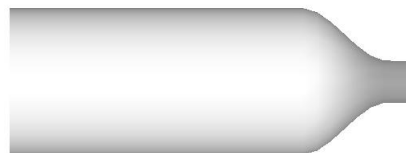
Figure 2: Sólido de revolución generado.